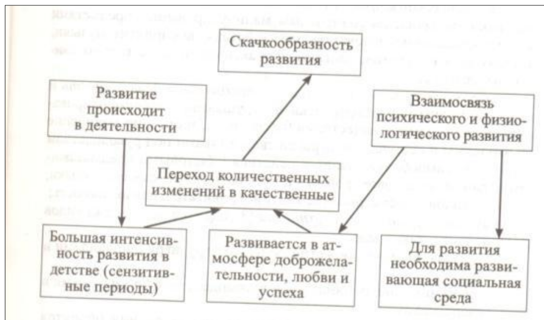
Рис. 1.1 Закономерности развития дошкольника

— подготовка на каждом возрастном этапе условий для освоения новых видов деятельности, форм и способов взаимоотношения со сверстниками, новой социальной позиции (от адаптации к социализации и самоутверждению и индивидуализации). Эти закономерности наглядно можно увидеть на рис. 1.1 «Закономерности развития ребенка».