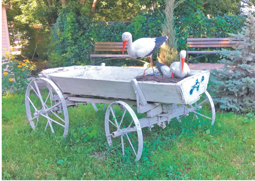
Центр образования № 1 г. Белгорода