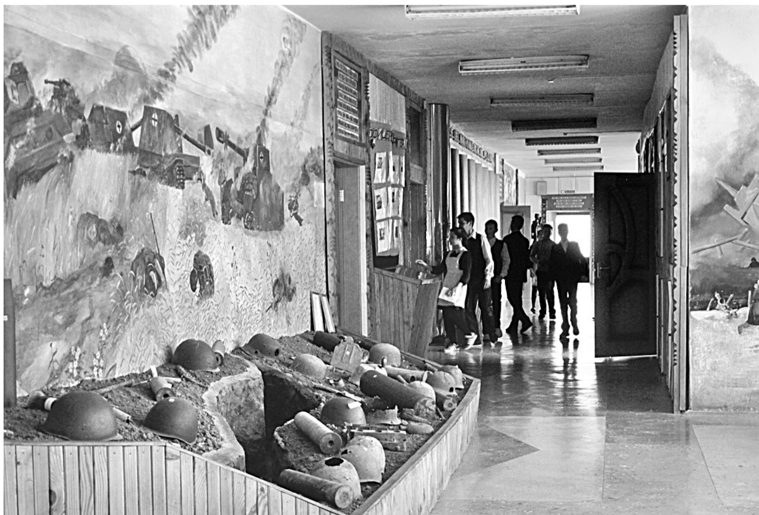
Школьный музей Великой Отечественной войны