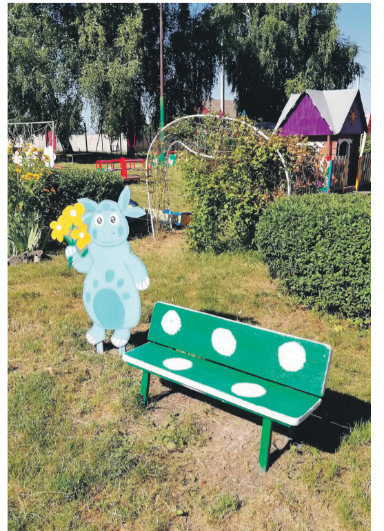
Детсад № 4 с. Алексеевка Корочанского района