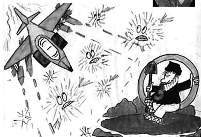
А вот таким детским «видением» браздов, ямщика и кибитки делятся друг с другом пользователи Интернета