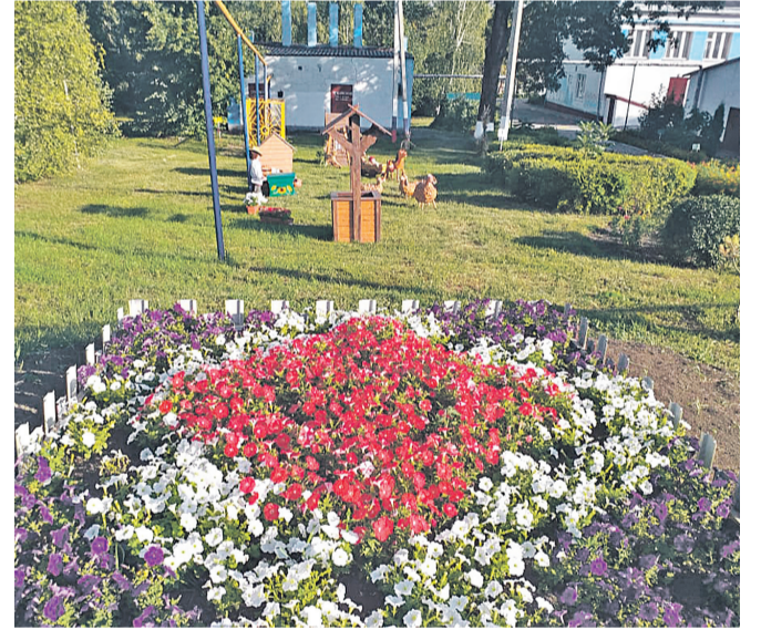
Старобезгинская школа Новооскольского городского округа