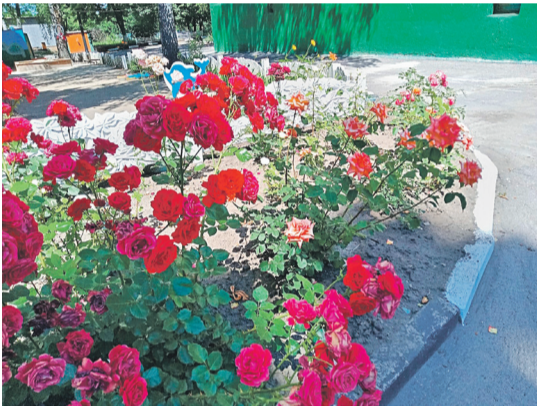
Детсад № 48 «Вишенка» г. Белгорода